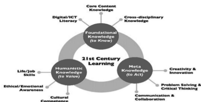
Gambar 1. Kompetensi Abad XXI